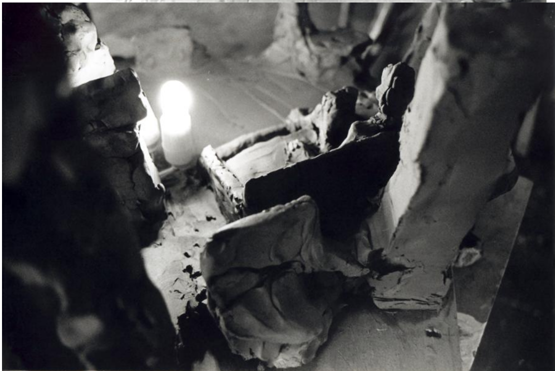
Εικόνες από ένα δικό μου μοντέλο από πηλό για το εσωτερικό ενός δωματίου