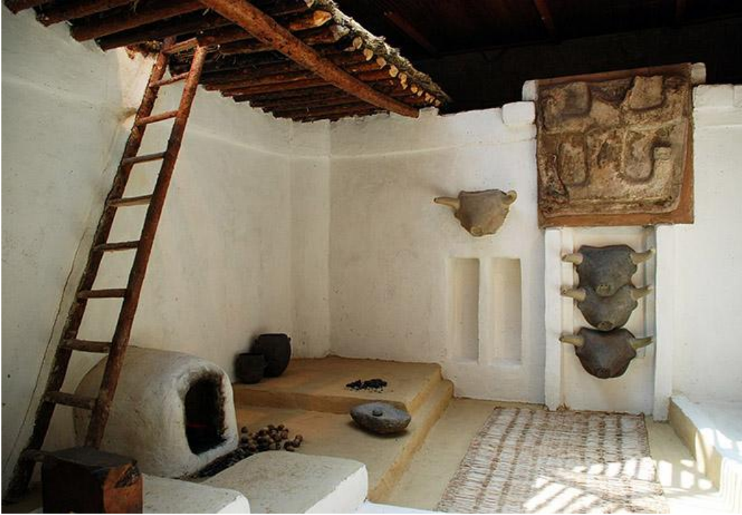
Εικόνες από αναπαραστάσεις του νεολιθικό οικισμό Τσαταλχογιούκ ( Catalhöyük ). (που στα Τουρκικά σημαίνει κουταλοπίρουνο)