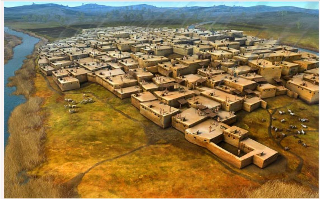
This is an artist's impression of Çatalhöyük. Image credit: Dan Lewandowski.

Το σπίτι λοιπόν που φαντάζομαι να είναι μια οικεία φωλιά ίσως μοιάζει με ένα κουτί, συνδεδεμένο και με άλλα, όπως ήταν μάλλον αυτά τα σπίτια, αλλά σε αντίθεση με τις οικείες του Τσαταλχογιούκ , θα ήθελα να έχει μεγάλα παράθυρα, με θέα, φτιαγμένο πάνω σε μικρό ύψωμα κοντά σε πηγή νερού, κάπως μακριά από τον δικό μας πολιτισμό. Φτιαγμένο από ξύλο, πέτρα, άμμο και πηλό, καθώς και ύφασμα με εσωτερική ρέουσα πηγή και φυτά καθαρισμού μπαμπού. Το φαντασιώνομαι να έχει χώρο εργαστηριακό, παρασκευής φαγητού και αντικειμένων. Η συντήρησή του ίσως θα ήταν άμεσα συνυφασμένη με ένα φυσικό κήπο και ίσως κάποια μικρά οικόσιτα πλάσματα. Θα ήθελα να έχει και κάποια σύγχρονα τεχνολογικά επιτεύγματα. Ίσως, μια φωλιά που μας θυμίζει τις σύγχρονες αρχιτεκτονικές Βερολινέζικες συγκατοικήσεις (WohnGemeinschaft). Περαιτέρω, στην παρουσίαση. Ευχαριστώ!