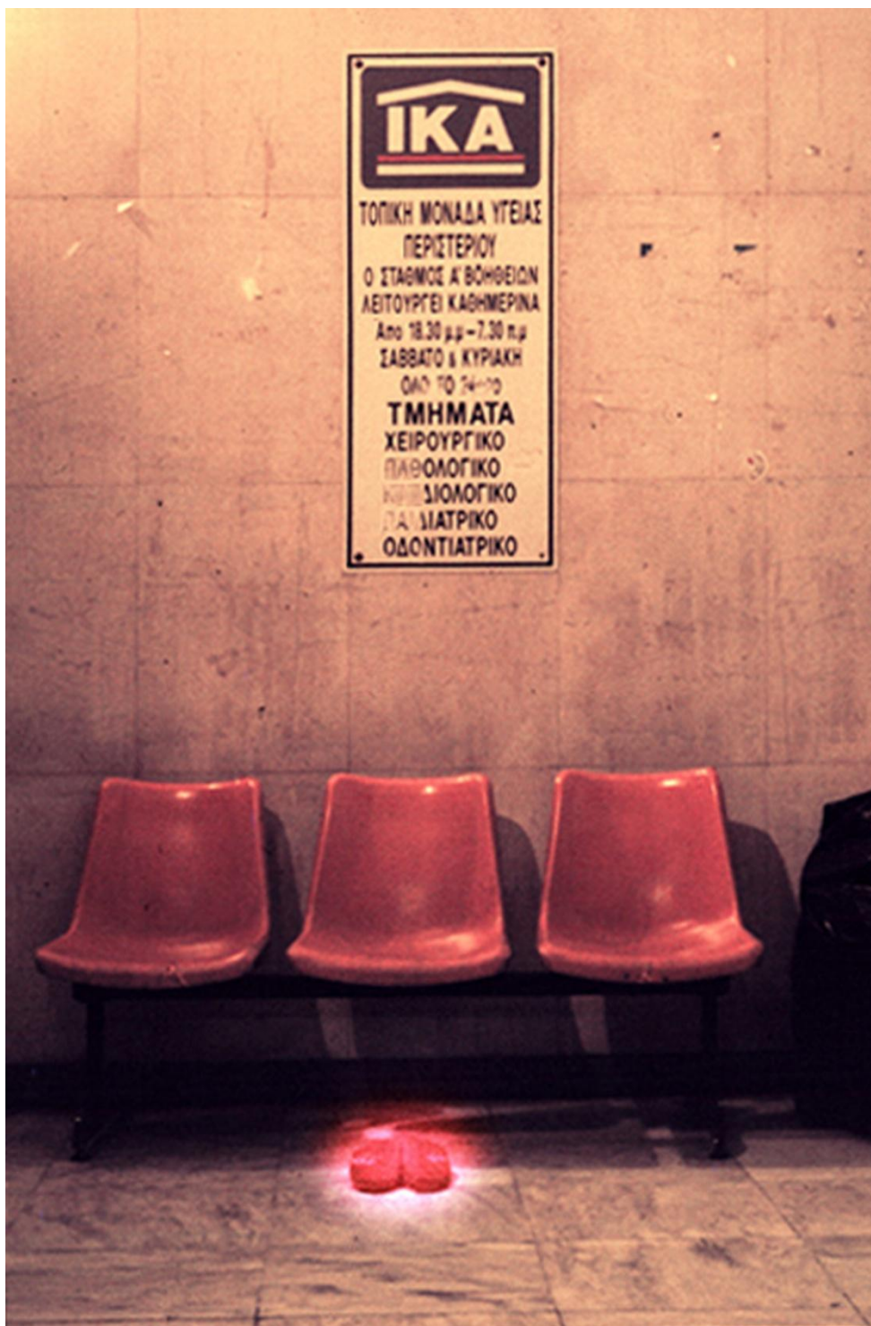
Η φωτογραφία Το εφήμερο μνημείο του ΙΚΑ #1 - Το τελικό προϊόν της πρώτης φάσης του έργου | Photo The ephemeral monument of IKA #1 - The final product of the first phase of the project

2001-3 | Παρουσία - Το Εφήμερο Μνημείο του ΙΚΑ [Α] [ΤΠΕ] [ΕΠ] [ΔΧ] [ΕΔ] [Φ] [ΕΧ] - 2001-3 | Presence - The Ephemeral IKA Monument [I] [SS] [EI] [PS] [PA] [Ph] [IS]