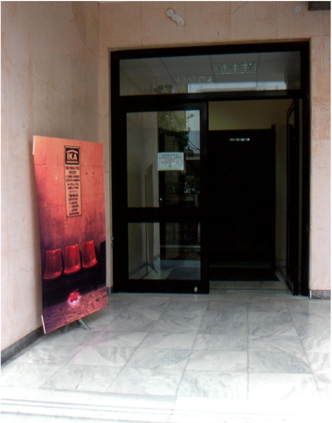
Φωτογραφίες-ντοκουμέντα από την 2 η φάση του εγχειρήματος, από την δράση στον δημόσιο χώρο και την διάδραση με τον κόσμο και τον χώρο | Photos from the 2nd phase of the project, from the action in the public space and the interaction with the people and the place