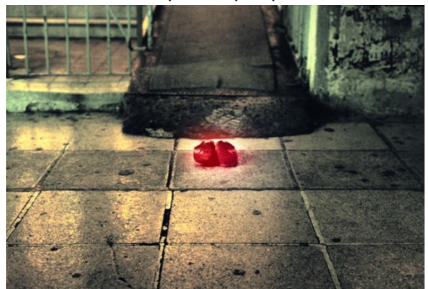
Η φωτογραφία Το εφήμερο μνημείο του ΙΚΑ #3 - Το τελικό προϊόν της πρώτης φάσης του έργου | Photo The ephemeral monument of IKA #3 - The final product of the first phase of the project

αυτό το σώμα που έλειπε ώστε να ολοκληρωθεί η εικόνα. Αυτό το στοιχείο έγινε ο λόγος για αυτό το έργο. Ακολούθησαν μια σειρά δράσεων: 1 η δράση ήταν να τοποθετήσω, εφήμερα, κάποιες παρόμοιες παντόφλες στο χώρο του ΙΚΑ σε 3 διαφορετικά σημεία, ώστε να συμπληρώσω αυτό το εκλιπόν «σώμα», να δημιουργήσω εκ νέου μian παρουσία. Η αναπαράσταση, δηλαδή, του «μαγικού» συμβάντος, και η φωτογράφησή τους. 2 η δράση ήταν η τοποθέτηση μιας από αυτές τις εικόνες στο σημείο. Η προσπάθεια αναπαράστασης του γεγονότος ήταν μια προσπάθεια να δημιουργήσω μian ανάλογη ατμόσφαιρα με εκείνη που ένοιωσα. Να ανταποδώσω στον τόπο την αύρα την οποία «συνέλαβα» με την φωτογράφηση. 3 η δράση ήταν, μέσω αυτής της εγκατάστασης της εικόνας, να έχω μian εφήμερη διάδραση με τον τόπο. Πιάνοντας συζητήσεις με τον περαστικό κόσμο, είχα σκοπό να δημιουργήσω δονήσεις στον δημόσιο χώρο. Η συνομιλία μου με περαστικούς ασθενείς και προσωπικό, αποτέλεσε ένα ντοκουμέντο πάνω σε μνήμες των ανθρώπων που έχουν ζήσει πολιτικές καταστάσεις του τόπου, καθώς και μια εποπτεία πάνω στην αισθητική τους.