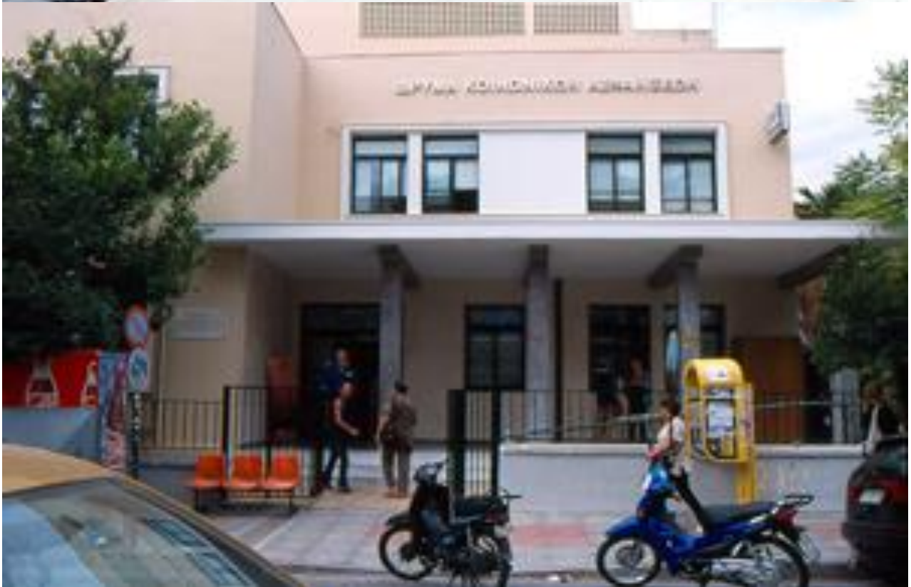
Φωτογραφίες-ντοκουμέντα από την 2 η φάση του εγχειρήματος, από την δράση στον δημόσιο χώρο και την διάδραση με τον κόσμο και τον χώρο | Photos from the 2nd phase of the project, from the action in the public space and the interaction with the people and the place