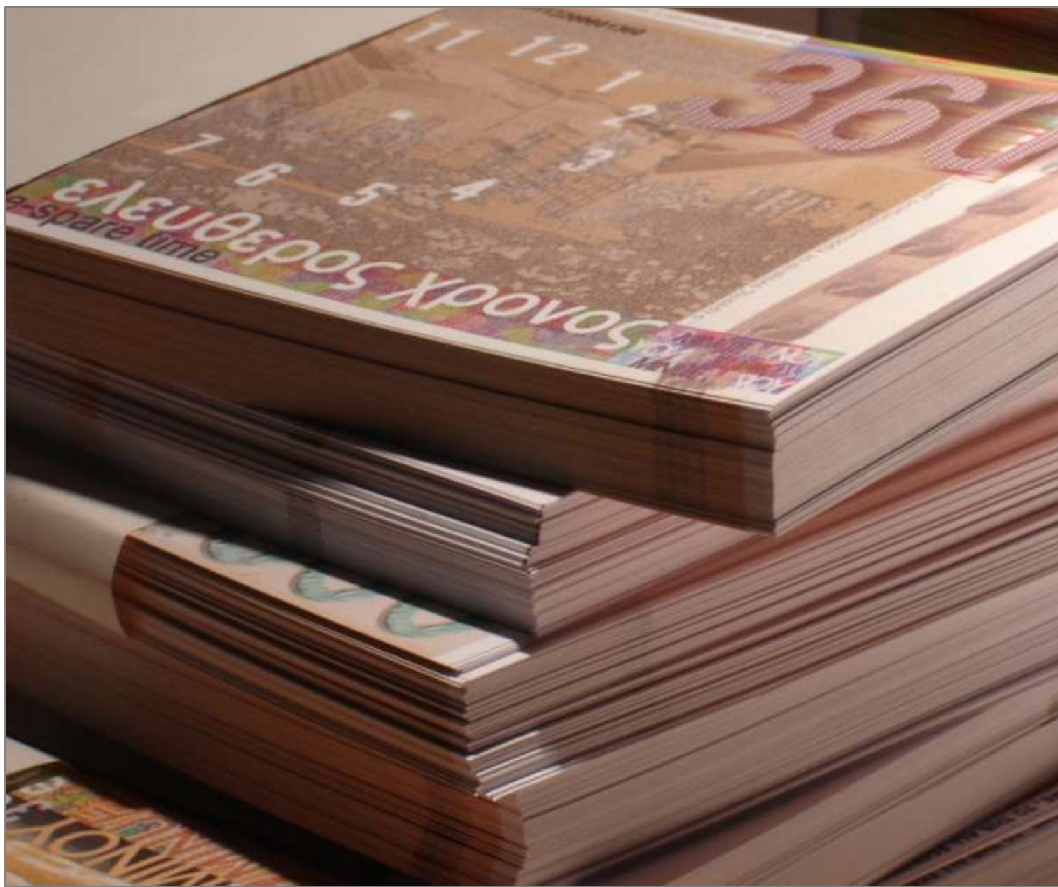
Η εγκατάσταση του έργου Χρονοχρήματα Μινού - Περίσσευμα Χρόνου - Ελεύθερος Χρόνος στο project Site/Θέση στην έκθεση ProTaseis που επιμελήθηκαν οι Ελπίδα Καραμπά, η Αν-Λορ Όμπερσον και ο Σωτήριος Μπαχτζετζής στο φεστιβάλ Πεδίο δράσης Κόδρα #6 στη Θεσσαλονίκη τον Σεπτέμβριο του 2006 (λεπτομέρεια) | The installation of the work Time Money - Spare Time - Leisure Time as it was presented in the ProTaseis exhibition curated by Elpida Karaba, Anne-Lor Oberson and Sotirios Bachtzizis at the Action Field Kodra #6 in Thessalonica in September 2006 (detail)