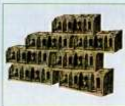
Μαίρη Ζυγούρη, προσέχδια για την έκθεση