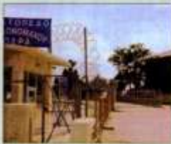
Άποψη του στραπέδου Κόδρα