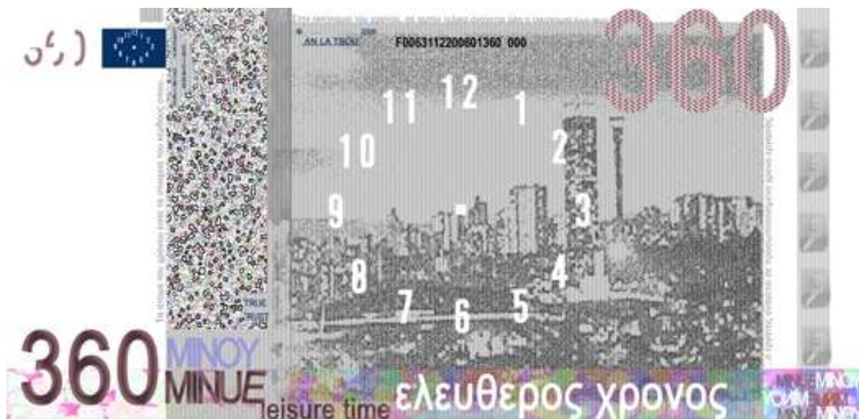
Ένα χαρτονόμισμα Μινού | A bill of Timemoney Minue