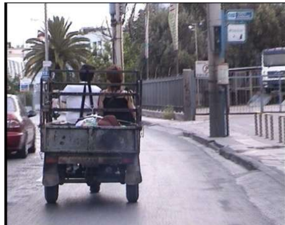
Η μεταφορά του «αμνού» μέσα από την Λεωφόρο Κηφισού και την Ιερά οδό | The transfer of the "lamb" through Kifissos Avenue and Iera Odos Avenue