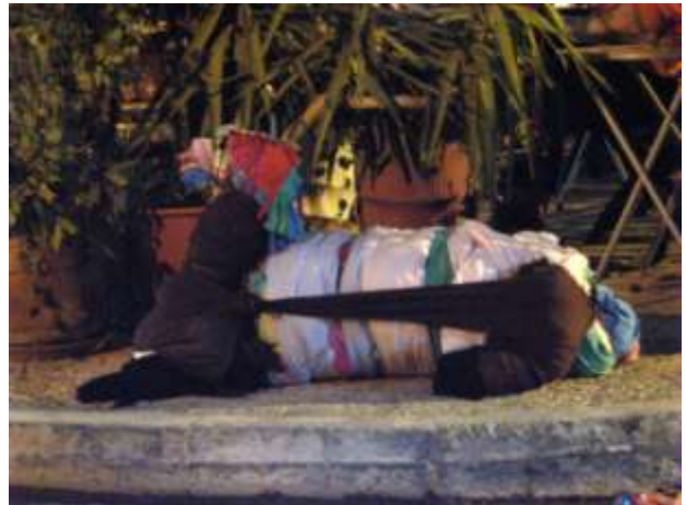
Outside of Beduin coffee-restaurant