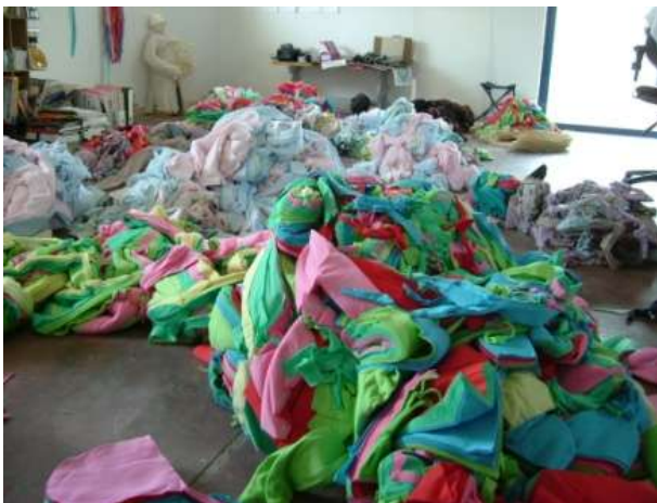
Το βασικό υλικό μέσα στο εργαστήριο | The basic material in the laboratory