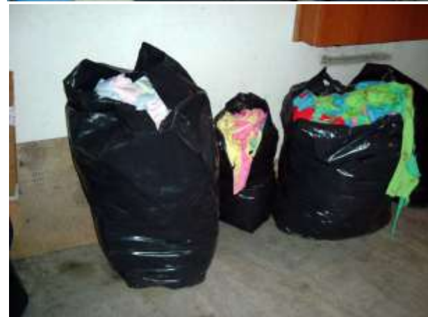
The basic material in the trash