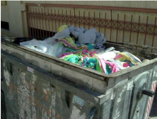
Το βασικό υλικό στον κάδο απορριμμάτων | The basic material in the trash can

μετατρέπω το καφενείο Beduin σε εναλλακτικό χώρο έκθεσης. Το εγχείρημα αυτό συνάδει με τον νομαδικό χαρακτήρα του Δικτύου, διότι είναι ένα εφήμερο και συνεχώς μετακινούμενο έργο που μεταλλάσσεται όπως και οι περιοχές σε κρίση μετασχηματισμού που εξετάζουμε.