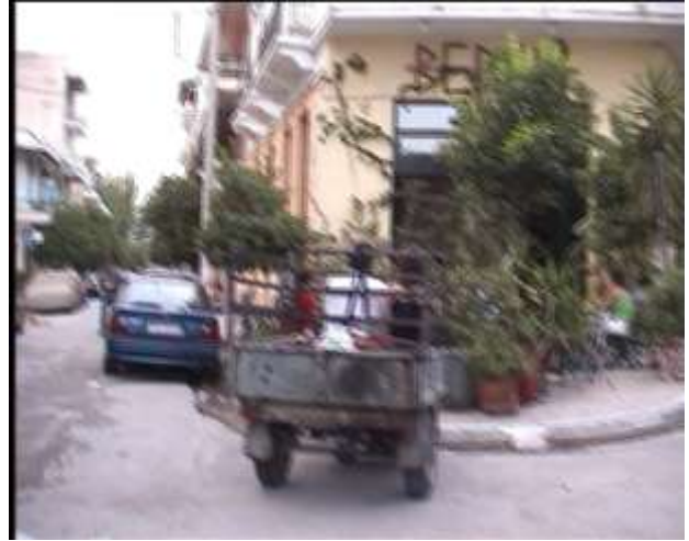
The transportation of the "Lamb" through the Kifissos Avenue and Iera Odos Street