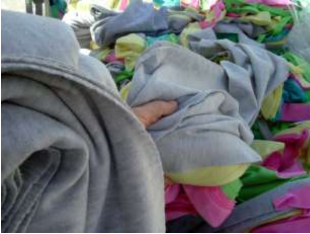
The basic material brought in the studio