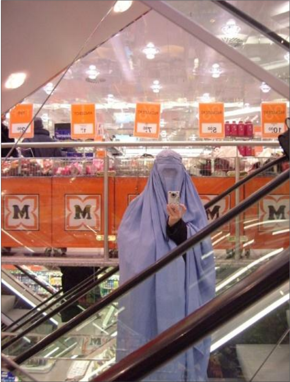
Στιγμιότυπο από την περιήγηση στην πόλη της Βαϊμάρης | Screenshot from the tour through the city of Weimar