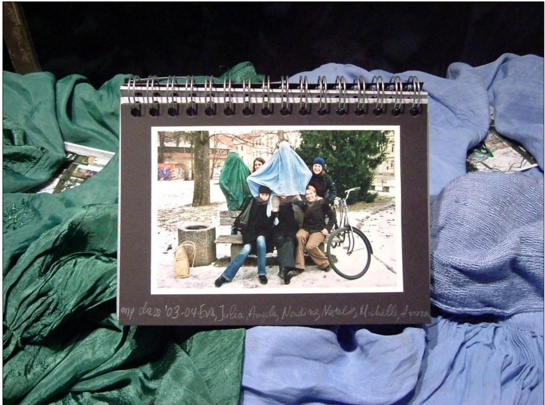
Η Τάξη μου '03-'04 | My Class '03-'04

Ψηφιακές φωτογραφίες και άλμπουμ | Digital photographs and album