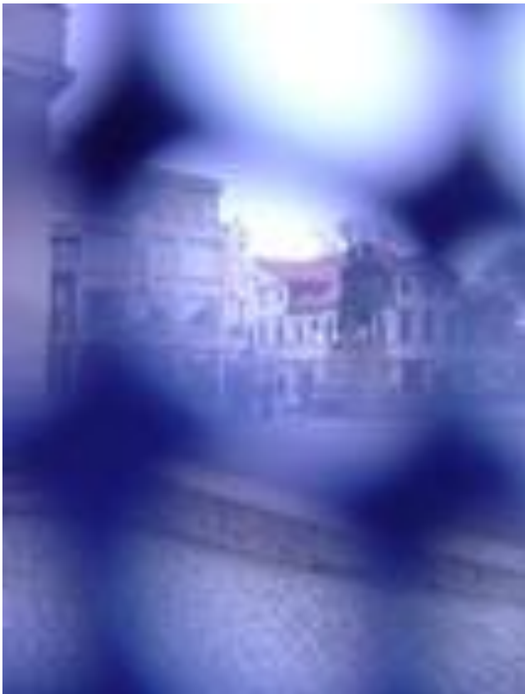
Θέα μέσα από την Μπούρκα - Ψηφιακή φωτογραφία | View through a Burka - Digital Photograph

2003-4 | Θέα μέσα από την Μπούρκα - Η Τάξη μου '03-'04 | Το Πέπλο: Προστασία / Σύμβολο / Αναπαράσταση [Α] [ΕΠ] [ΔΧ] [ΕΔ] [Φ] - 2003 | View through a Burka - My Class '03-'04 | The Veil [I] [EI] [PS] [PA] [Ph]