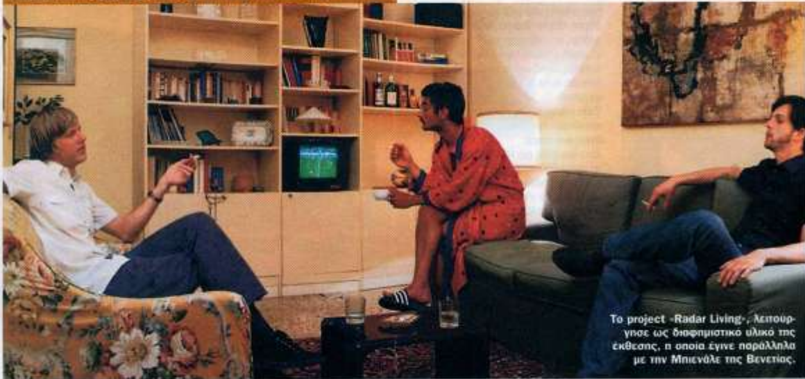
Το project «Radar Living», λειτουργεί ως θεματιστικό υλικό της έκθεσης, η οποία έγινε παράλληλα με την Μπιενάλε της Βενετίας.

Επιμέλεια Γιώργος Βαρβακίδης, Στάθης Παναγιώτης