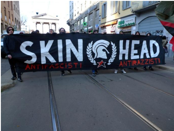
Πορεία για τον DAX, Μιλάνο, 2013 | Demonstration for DAX, Milan-Italy, 2013