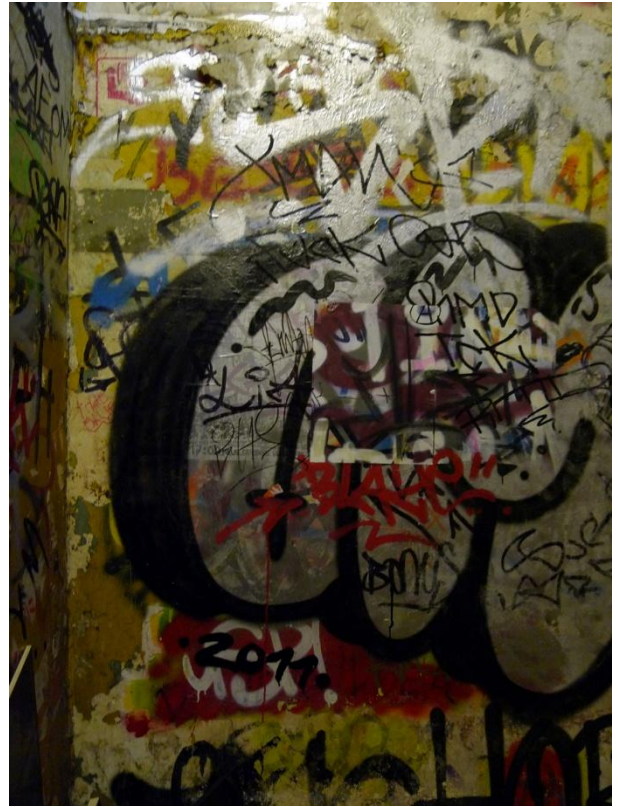
Γραφίματα μέσα στην κατάληψη Rote Flora, Αμβούργο, 2012 | Writings-graffiti inside the Rote Flora occupation, Hamburg-Germany, 2012