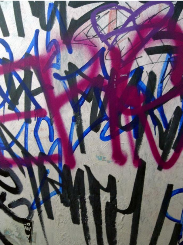
Γραφίματα μέσα στην κατάληψη Rote Flora, Αμβούργο, 2012 | Writings-graffiti inside the Rote Flora occupation, Hamburg-Germany, 2012