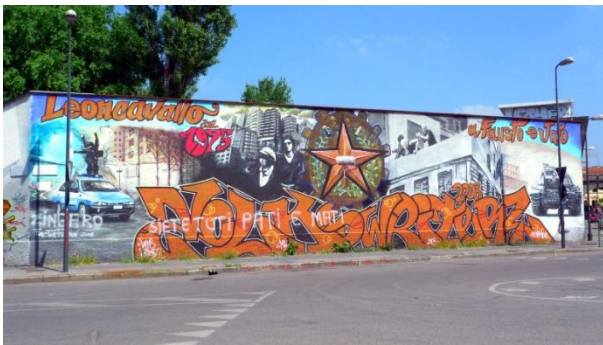
Κοινωνικό κέντρο Leoncavallo, Μιλάνο, 2011 | Social Center Leoncavallo, Milan-Italy, 2011