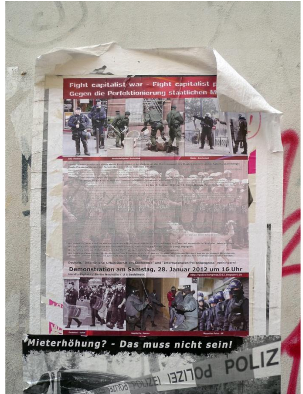
Malaka-Griechenland, Fight Capitalist War, Βερολίνο, 2012 | Malaka-Griechenland, Fight Capitalist War, Berlin-Germany, 2012