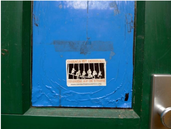
Oaxaca ist überall - Gefangene auf die Straße (Η Οαχάκα είναι παντού – Φυλακισμένοι στο δρόμο!) Βερολίνο, 2012 | Oaxaca ist überall - Gefangene auf die Straße (Oaxaca is everywhere – Prisoners on the street!) Berlin-Germany, 2012