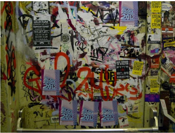
Γραφίματα μέσα στην κατάληψη Rote Flora, Αμβούργο, 2012 | Writings-graffiti inside the Rote Flora occupation, Hamburg-Germany, 2012