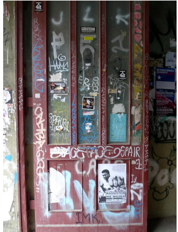
RASSISTEN NIE WIEDER! (Ποτέ ξανά ρατσιστές) Βερολίνο, 2012 | RASSISTEN NIE WIEDER! (Never again racists) Berlin-Germany, 2012