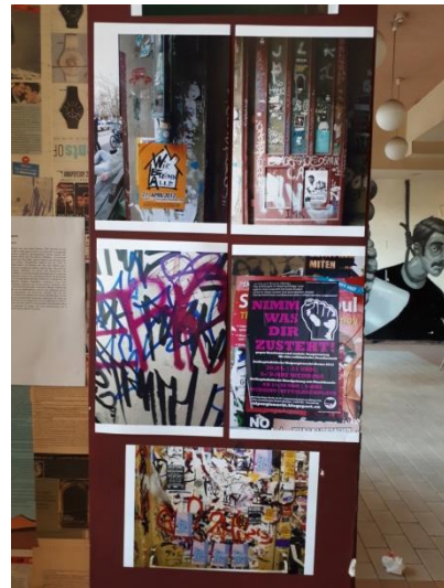
Από το 1 ο φεστιβάλ του Αυτοδιαχειριζόμενου Κυλικείου Νομικής, Αθήνα, Μάιος 2019 | From the 1st festival of the Self-Organized Law School Canteen, Athens, May 2019