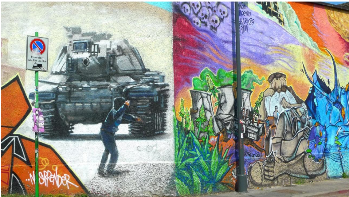
Φωτογραφία από τα graffiti στο κτήριο του κοινωνικού κέντρου Leoncavallo στο Μιλάνο, Ιταλία | Photo from the graffiti on the building of the social center Leoncavallo in Milan, Italy