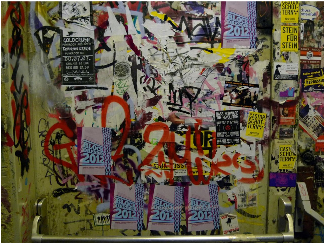
Φωτογραφία από το κτήριο της κατάληψης Rote Flora στο Αμβούργο, Γερμανία | Photo from the building of the Rote Flora occupation in Hamburg, Germany