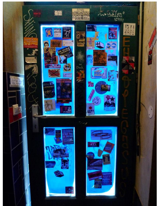
Κινηματική βερολινέζικη πόρτα, 2012 | Berliner "movement" Door, 2012