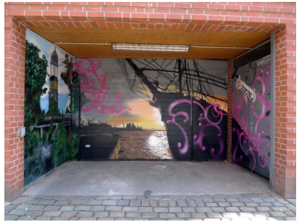
Περιοχή San Pauli, Αμβούργο, 2012 | San Pauli District, Hamburg-Germany, 2012