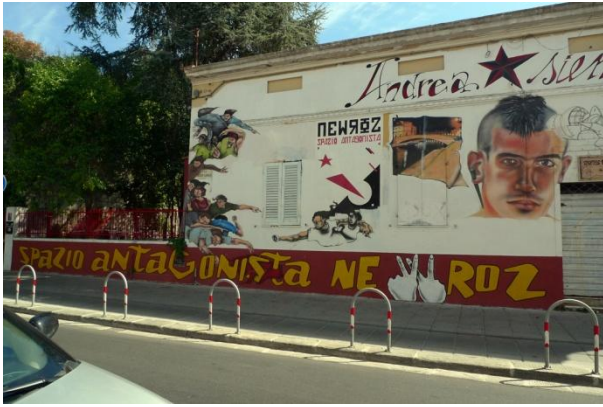
NewRoz Spazio Antagonista Πίζα-Ιταλία, 2009 | NewRoz Spazio Antagonista Pisa-Italy, 2009