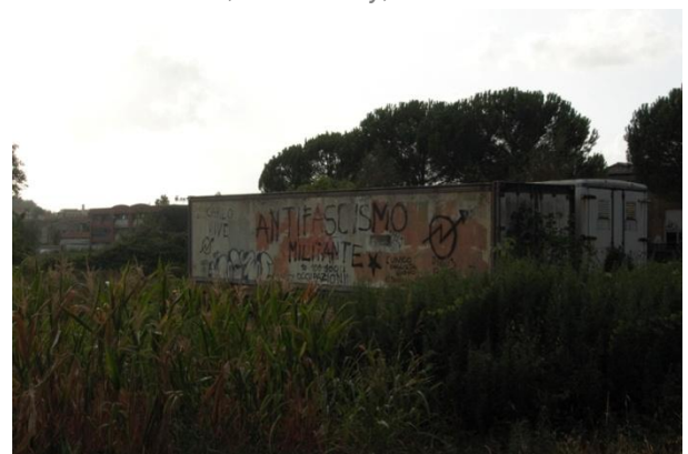
Antifascismo Militante, Πίζα-Ιταλία, 2009 | Antifascismo Militante, Pisa-Italy, 2009