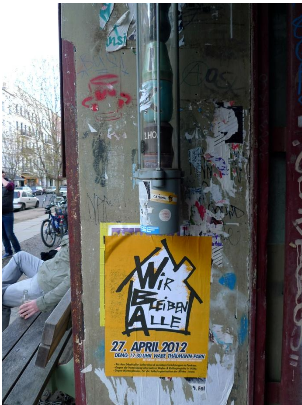
Wir bleiben alle! (Θα παραμείνουμε όλοι) Βερολίνο, 2012 | Wir bleiben alle! (We all stay!), Berlin-Germany, 2012