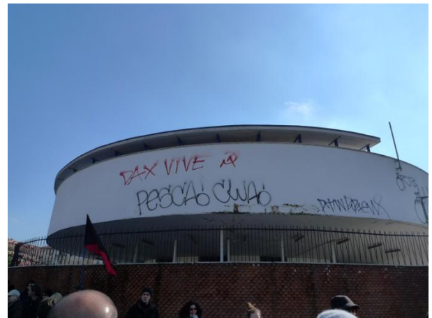
Πορεία για τον DAX, Μιλάνο, 2013 | Demonstration for DAX, Milan-Italy, 2013