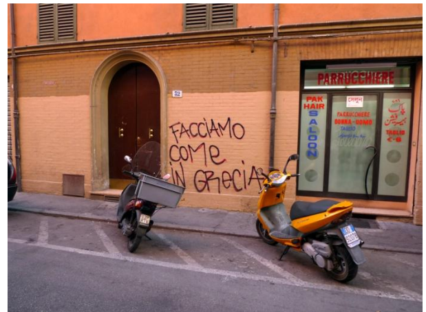
Facciamo come in Grecia, Μιλάνο, 2011 | Facciamo come in Grecia, Milan-Italy, 2011