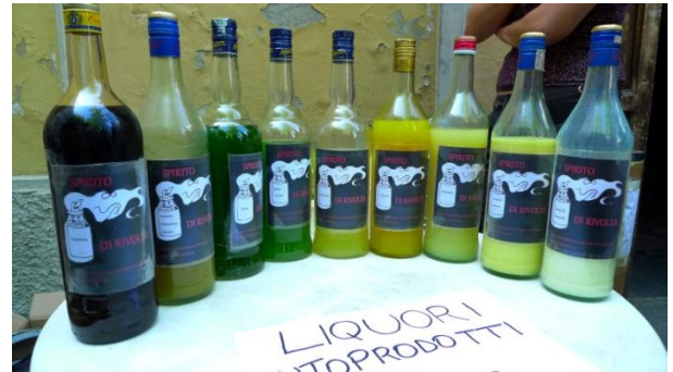
Λικουρι Αυτοπροδοτι, πρωτομαγιά στην Αναρχική Ομοσπονδία F.A.I., Μιλάνο, 2011 | Liquori Autoprodoti, May Day in the Anarchist Federation F.A.I., Milan-Italy, 2011