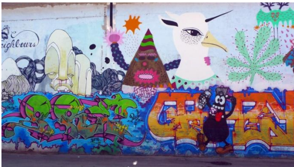
Κοινωνικό κέντρο Leoncavallo, Μιλάνο, 2011 | Social Center Leoncavallo, Milan-Italy, 2011