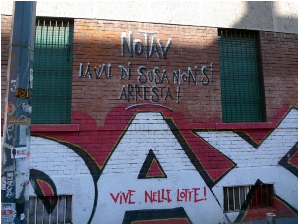
NoTAV-Πορεία για τον DAX, Μιλάνο, 2013 | NoTAV-Demonstration for DAX, Milan-Italy, 2013