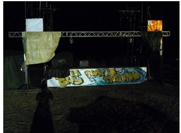
Noi la crisi, non la paghiamo, Global Beach-Lido, Βενετία-Ιταλία, 2009 | Noi la crisi, non la paghiamo, Global Beach-Lido, Venice-Italy, 2009

Οι φωτογραφίες που παρουσιάστηκαν σε τίτλους: