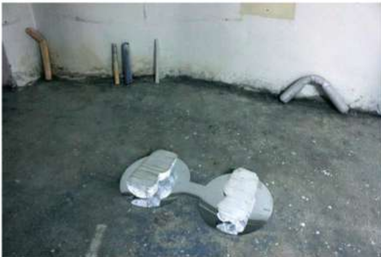
Works by Kostas Tzilmoufis

Δημοσίευση της έκθεσης Πόλη σε κομμάτια [City in pieces] στο ηλεκτρονικό περιοδικό und.Athens | Publication of the exhibition City in pieces in the online magazine und.Athens