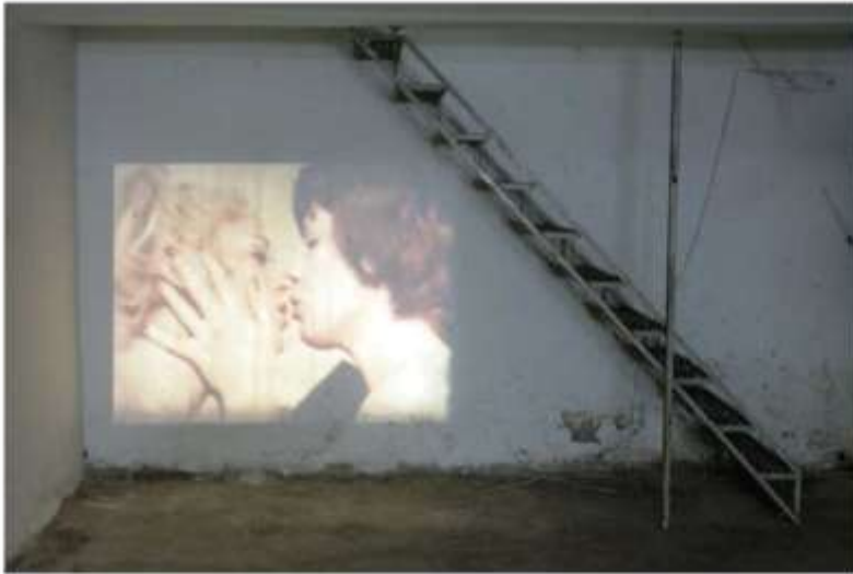
Work by Eva Stefani