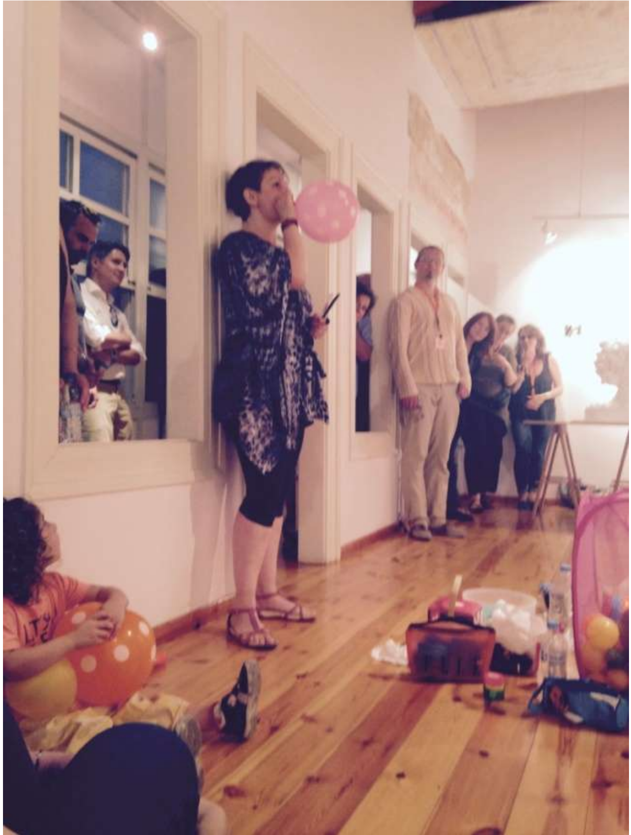
Δράση κατά τη διάρκεια της επιτέλεσης – In action during the performance