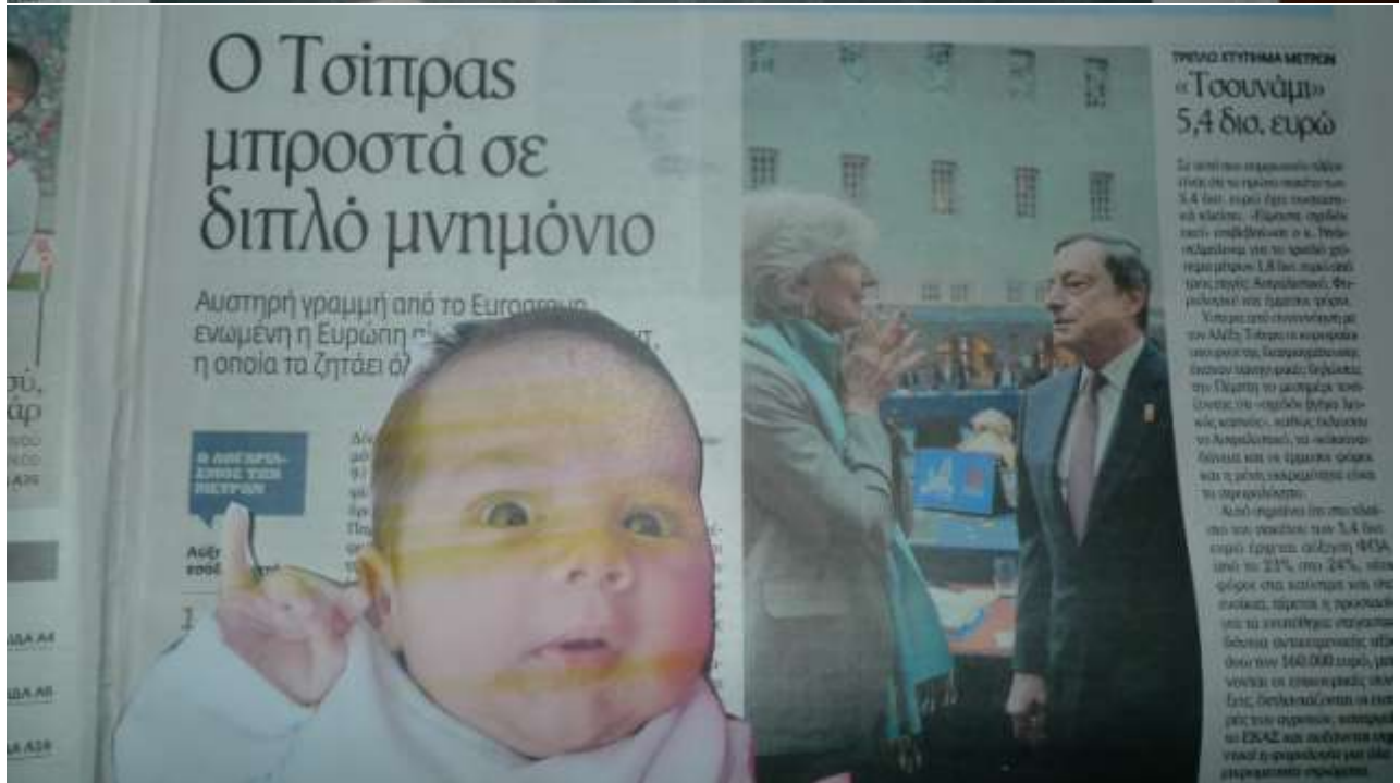
Εκτροπές-κολάζ φύλλων εφημερίδων – Detournements-collage newspaper pages