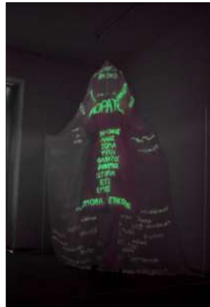
Η εγκατάσταση, φώτα σβηστά – ανοιχτά | The installation, lights off and on

μιαν τεχνική γλώσσα μιας άλλης εποχής, φτιαγμένη για να γίνει το εργαλείο επικοινωνίας ανθρώπων προερχόμενοι από διαφορετικές εθνικότητες και κουλτούρες που συγκροτούσαν τον λαό μιας αυτοκρατορίας. Κάνω μ' αυτόν τον τρόπο ένα συσχετισμό με τη παγκόσμια σημερινή χρήση της αγγλικής γλώσσας. Η "Θεά" εδώ αντιπροσωπεύει την ιδέα που προκύπτει από το σύστημα και την δικτύωση που δημιουργείται στην εποχή της πληροφορίας.