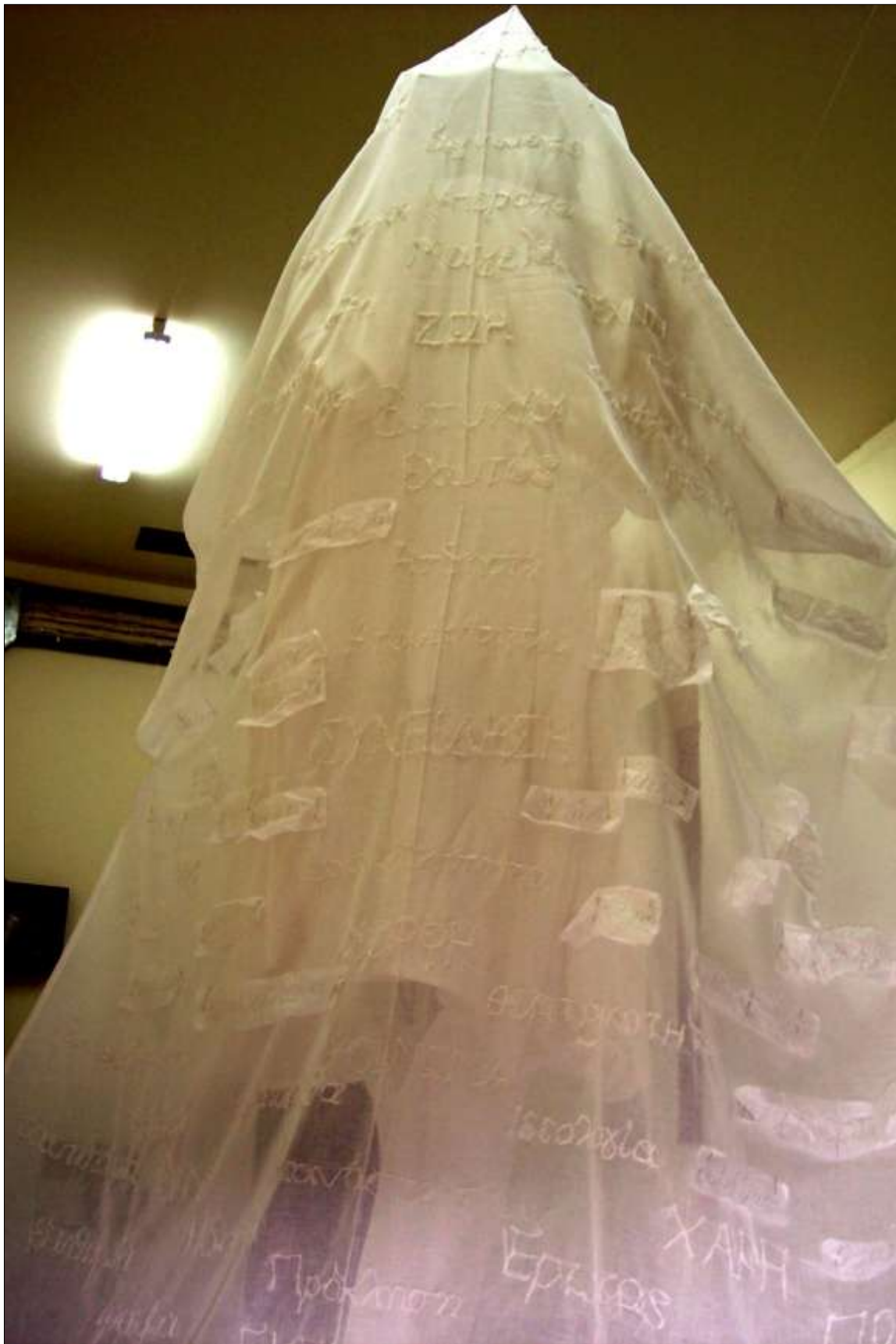
Η εγκατάσταση, πίσω όψη φώτα σβηστά – ανοιχτά | The installation, backside lights off and on