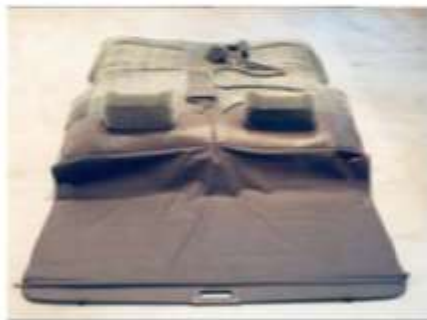
Nathalie Bruys (NL) Untitled (2007)

Στα πλαίσια της έκθεσης Invisible Systems θα παρουσιαστούν τα ακόλουθα projects: